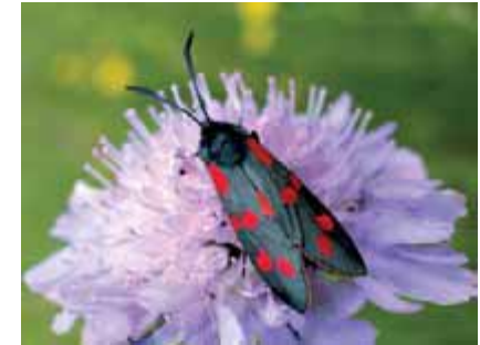
Blutströpfchen auf einer Skabiosenblüte

Seit 2010 ist der Südteil eines der Projektgebiete des von der Europäischen Union geförderten Lifeprojekts „Aurinia“ der Stiftung Naturschutz Schleswig-Holstein. Der Anfang der 90er-Jahre des vorigen Jahrhunderts im Lande ausgestorbene Goldene Scheckenfalter soll nun im Schäferhaus wieder angesiedelt werden. Borstengrasrasen, Heiden, nährstoffarme Feuchtwiesen, blütenreiche Ma-