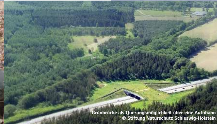
Grünbrücke als Quermöglichkeit über eine Autobahn