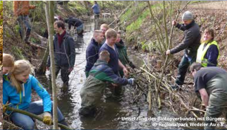
Umsetzung des Biotopverbundes mit Bürgern