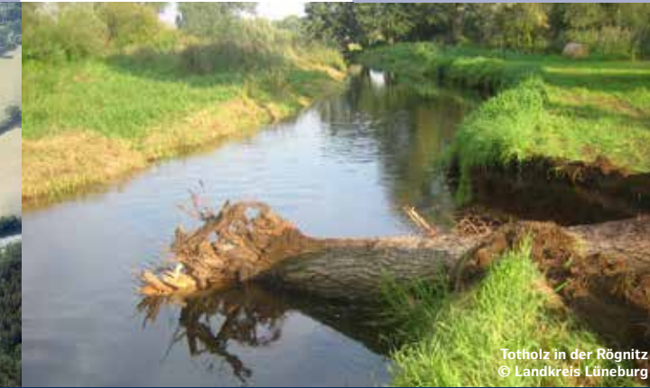
Totholz in der Rönnitz