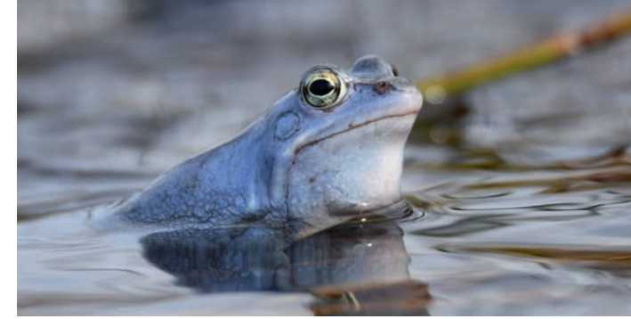
Der Moorfrosch – nur eine von vielen bedrohten Arten der Moore.