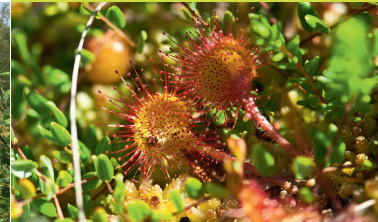
Auch der Sonnentau braucht das Moor.

Mit 1x MoorFutures kompensierst du 1 Tonne CO 2 !