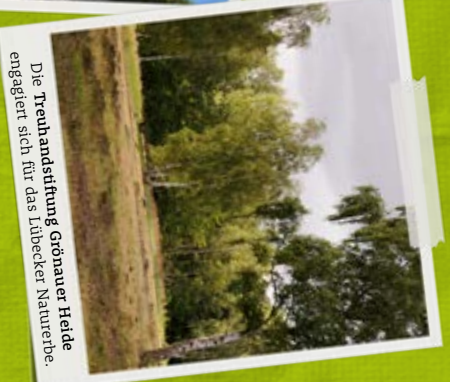
Die Treuhandstiftung Grönauer Heide engagiert sich für das Lübecker Naturerbe.