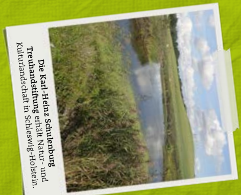
Die Karl-Heinz Schulenburg Treuhandstiftung erhält Natur- und Kulturlandschaft in Schleswig-Holstein.