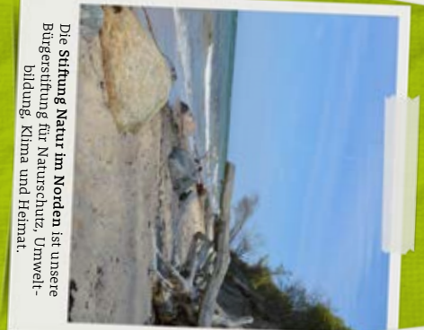
Die Stiftung Natur im Norden ist unsere Bürgerstiftung für Naturschutz, Umweltbildung, Klima und Heimat.