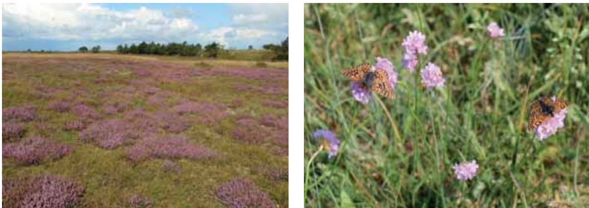
Abb. 30: Blühende Küstenheide auf der Geltinger Birk; gleichzeitiger Blütenbesuch von Goldenem Scheckenfalter und Wegerich-Scheckenfalter an Strandnelke

Auf der Geltinger Birk haben sich flechtenreiche Küstenheiden wie auch beweidungstypische Borstgrasrasen wieder flächenhaft ausgebildet und ausgebreitet. Naturschutzfachlich problematische Arten, wie invasive Kartoffelrose oder auch die zuvor dominanten Brombeerbestände, konnten hingegen deutlich reduziert werden. Die vorhandene Population des Teufelsabbiss hat sich sichtbar erholt und mit Hilfe der Anpflanzungen in der Fläche stabilisiert. Der stark gefährdete Wegerich-Scheckenfalter ( Melitaea cinxia ) konnte aufgrund der Maßnahmen sein besiedeltes Areal erweitern und ist in die hinterdeichs liegenden Flächen eingewandert.