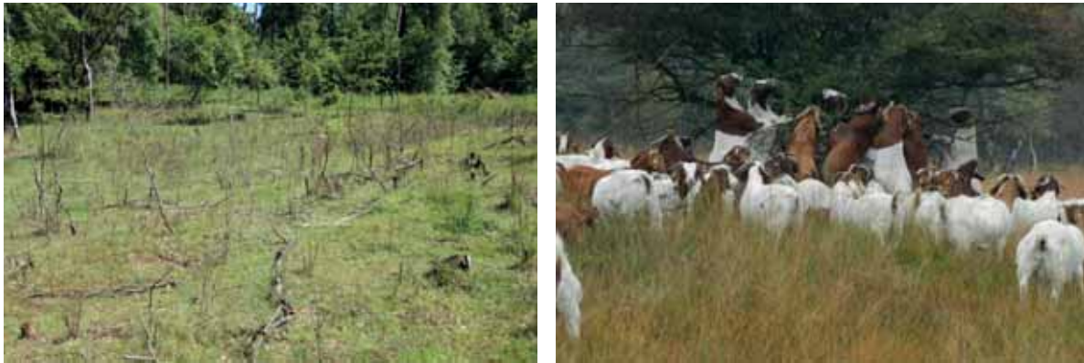
Abb. 20: nach mehreren Weidegängen abgestorbene Spätblühende Traubenkirschen; Burenziegen fressen bevorzugt Blätter und schälen die Rinde vieler Gehölzarten

Ziegen beweiden bevorzugt viele Pflanzenarten, die naturschutzfachlich problematisch sind und sehr oft von Schafen gemieden werden. Dazu zählen Kiefer, Spätblühende Traubenkirsche, Brombeere, Schlehen, Birken, aber auch harte Obergräser wie Pfeifengras oder Kanadische Goldrute. Die Ziegen dringen dabei in dichte Brombeer- und Schlehenbüsche oder Kartoffelrosenbestände ein und entlauben diese vollständig. Schafe meiden solche Bereiche oder werden um diese herumgetrieben, da sie sich mit ihrer Wolle ansonsten verfangen.