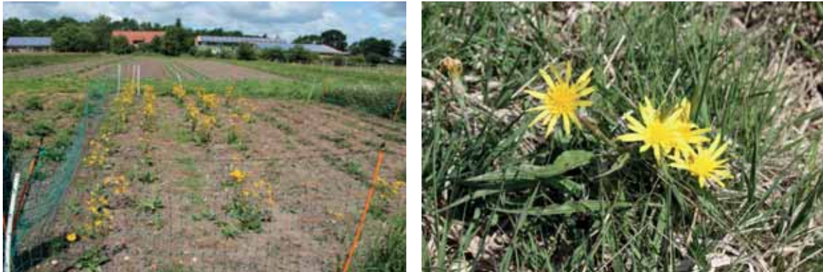
Abb. 15: Blick auf das Mutterpflanzenquartier von Arnika; blühende Niedrige Schwarzwurzel nach Ausspflanzung

Auch der jahreszeitlich günstigste Zeitpunkt zur Sammlung und Ausbringung der Samen ist artspezifisch unterschiedlich. Die Samen des Teufelsabbiss benötigen unbedingt eine Stratifikation durch Kälteeinwirkung, weshalb sie entweder im Kühlschrank zwischengelagert oder rechtzeitig im Freiland ausgebracht werden sollten. Im LIFE-Aurinia-Projekt hat sich für den Teufelsabbiss der September und für Klappertopf der Zeitraum von Juli bis November bewährt. Das Saatgut sollte möglichst kurzzeitig gelagert werden, da die Keimfähigkeit mit der Zeit abnimmt.