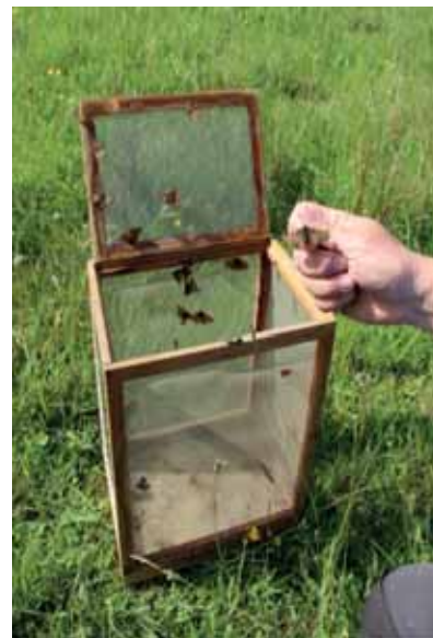
Abb. 28: Aussetzung gezüchteter Raupen an Teufelsabbiss sowie von Faltern

Nach den in LIFE-aurinia gemachten Erfahrungen erscheint es trotzdem naturschutzfachlich sinnvoll, sowohl Raupen zu unterschiedlichen Zeitpunkten im Jahresverlauf sowie Falter in einem Gebiet auszusetzen, da der Wiederansiedlungserfolg unter anderem stark vom Witterungsverlauf abhängt, weshalb eine zeitliche Differenzierung hilfreich ist.