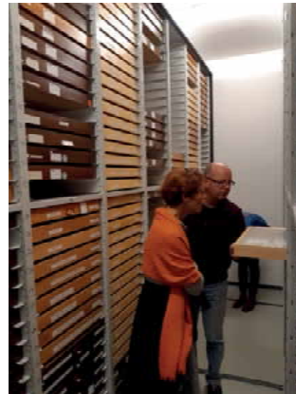
Abb. 24: Labor in Müncheberg und die Insektensammlung des Zoologischen Museums Kiel