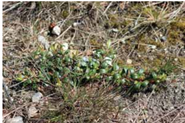
Abb. 10: aus ausgebrachten Samen aufgewachsene Arnika; junge Pflanze der Echten Bärentraube ( Arctostaphylos uva-ursi ) auf einer Plaggfläche in Löwenstedt