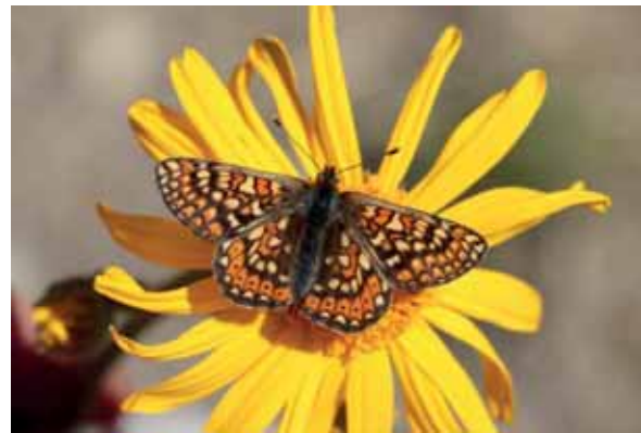
Abb. 2: Die Falter sind bei der Nektarsuche nicht wählerisch, bevorzugen aber ganz eindeutig Arnika, sobald diese blüht.

Gerade die extrem unterschiedlichen Witterungsverläufe der letzten beiden Projektjahre haben die hohe Bedeutung der Standortvielfalt verdeutlicht. So können über viele Jahre erfolgreich besiedelte Lebensräume durch Extremwitterungsereignisse plötzlich nicht mehr ausreichen.