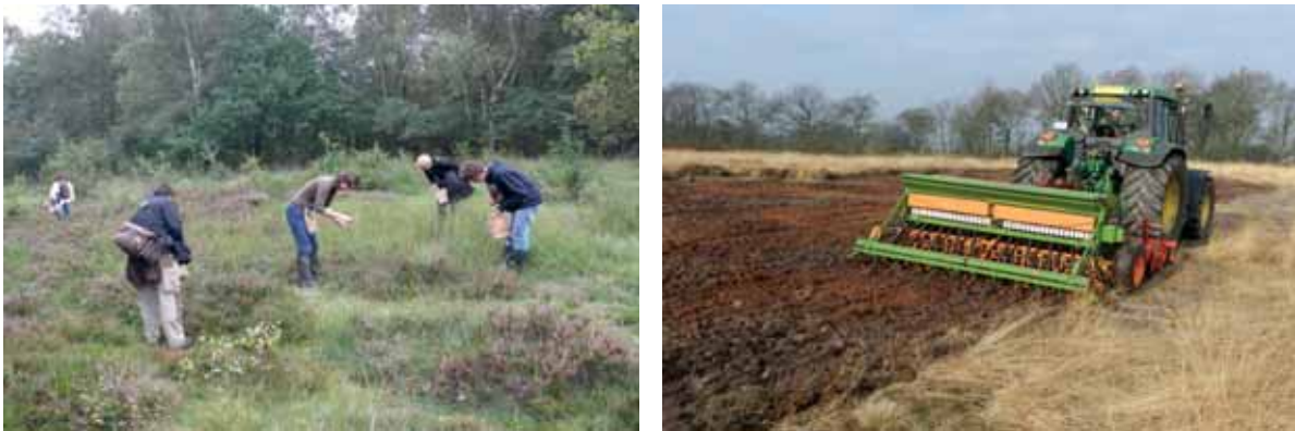
Abb. 14: die Sammlung per Hand ist zeit- und personalaufwändig; zur Aussaat von größeren Mengen bietet sich eine -Kombination von Kreiselegge mit Saatmaschine an

Die Vorteile liegen in der gezielten Beerntung ausgewählter Pflanzenart zum optimalen Zeitpunkt der Samenreife. Die Ernte per Hand bietet sich zudem vor allem bei kleinen Beständen an, wo ein maschineller Einsatz nicht lohnt oder dieser aufgrund der Geländebeschaffenheit nicht möglich ist. Zudem ist das Saatgut tatsächlich handverlesen, d.h. es werden selektiv wirklich nur reife sowie artenreine Samenstände geerntet.