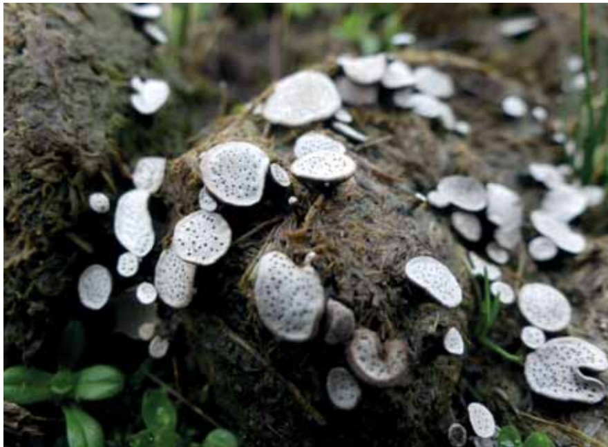
Abb. 21: die Punktierte Porenscheibe (Poronia punctata, det M. Lüderitz) ist äußerlich kaum von P. erici zu unterscheiden; das abgebildete Exemplar stammt von Fehmarn; Funde aus dem Projektgebiet Nordoe wurden noch nicht eingehend untersucht; auch Pilze werden durch Anthelmintikarückstände im Kot stark beeinträchtigt

Aus diesen Gründen sowie in Verbindung mit den Auflagen aus dem Biolandbau dem einige Pächter angehören, wurden die Behandlung von Rindern und Pferden auf den Projektflächen stark eingeschränkt. Die Ziegenherden wurden nur in den Wintermonaten während der Aufstallungszeiten, maximal bis vier Wochen vor Weideauftrieb mit Medikamenten behandelt.