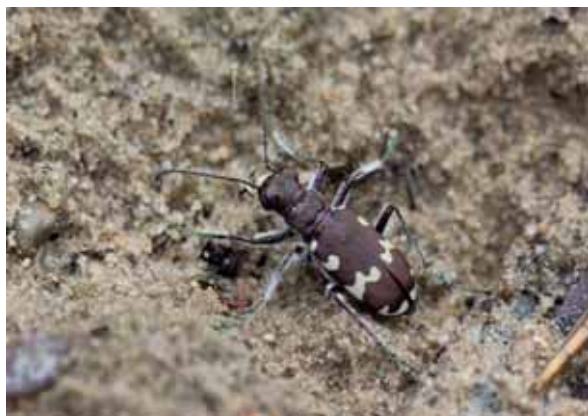
Abb. 32: Plaggbereich mit durch Schilder gekennzeichneten neu aufgekommenen Bärentrauben; Sandlaufkäfer leben nur im Bereich offener Bodenstellen