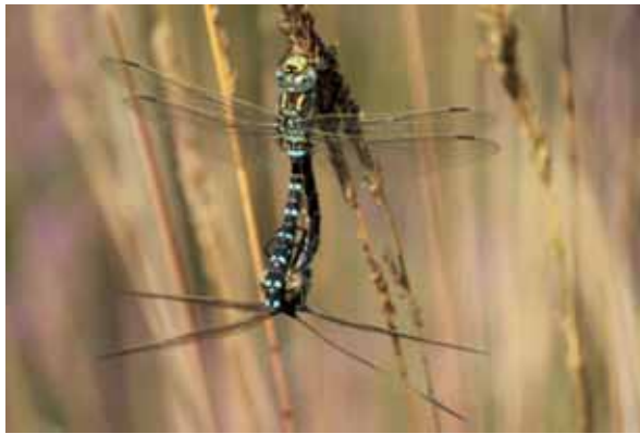
Abb. 31: die unscheinbare Thymian-Seide lebt in Norddeutschland bevorzugt an Besenheide; Paarungsrad der Torf-Mosaikjungfer

Im NSG Löwenstedter Sandberge haben sich auf Plaggflächen zahlreiche Bärentrauben ( Arctostaphylos uva-ursi ) angesiedelt, denen offenbar die Freistellung entweder bei der Keimung oder beim Wurzelausschlag geholfen hat. Zuvor war die Art im Gebiet nur noch von zwei sehr kleinflächigen Beständen bekannt. Sie ist in SH extrem selten und vom Aussterben bedroht.