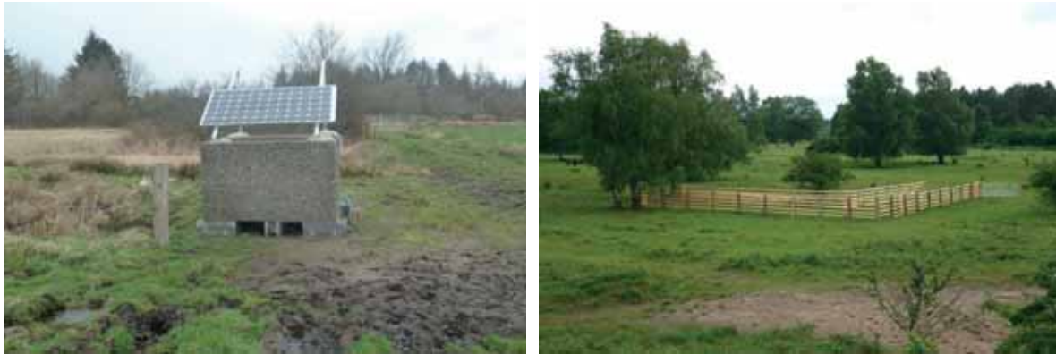
Abb. 23: Mit Hilfe von Solarpanelen können Elektrozäune unabhängig vom Stromnetz betrieben werden; Fanggatter erleichtern das erforderliche Tiermanagement, beispielsweise für vorgeschriebene veterinärmedizinische Untersuchungen

Der Vorteil unterschiedlicher Vegetationsstrukturen bzw. die hohe Bedeutung kleinräumiger Nutzungsvielfalt hat sich in der Projektlaufzeit besonders in den letzten beiden Projektjahren gezeigt, die von extremen und sehr gegensätzlichen Witterungsverläufen geprägt waren. So wurde das Jahr 2017 von einer kühl-nassen Witterung mit sehr vielen Niederschlägen dominiert, wodurch Raupengespinnste des Goldenen Scheckenfalters bevorzugt auf Dünenkuppen und anderen trocken-warm exponierten Standorten zu finden waren. Demgegenüber verlief das Jahr 2018 mit einer für hiesige Verhältnisse extremen trocken-heißen Witterungsperiode, so dass sehr viele Pflanzen auf exponierten Standorten vertrockneten, aber an kühl-feuchten Standorten erfolgreich überdauerten.