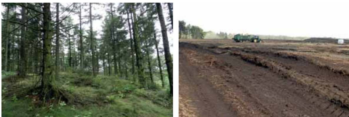
Abb. 4: Blick auf die bei Projektbeginn noch vorhandene standortfremde Nadelholzplantage auf den Binnendünen; Abtrag der akkumulierten organischen Auflage

Auf den Heideflächen dürfen ansonsten keinerlei Gehölze gepflanzt oder geduldet werden, da gerade die hochgradig spezialisierten Arten der Heiden auf eine schnelle Abtrocknung ihrer Lebensräume nach Niederschlägen angewiesen sind. Dazu trägt auch der über die Flächen streichende Wind wesentlich bei, weshalb dieser zumindest über die zentralen Flächen möglichst ungehindert wehen können muss.