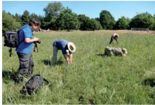
Abb. 29: Die projektbegleitenden Experten bei der Suche nach Faltern sowie Eispiegeln

Insgesamt fanden drei Treffen mit Begehungen statt, jeweils zu Anfang, zur Halbzeit und zum Ende des Projektes. Die Wiederansiedlungen erfolgten nur in Gebieten, die von der Expertenrunde im Vorfeld als dafür geeignet bewertet wurden.