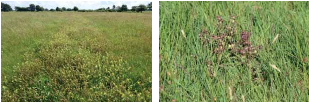
Abb. 11: erfolgreich entlang eines Transektes ausgebrachter Klappertopf; abgeblühtes Sumpf-Läusekraut in Feuchtgrünland

Der Einsatz von Klappertopf als Antagonist der Gräser verlief im LIFE-Aurinia-Projekt sehr erfolgreich, die wüchsigen Obergräser konnten wirkungsvoll reduziert und die Flächen für Kräuter optimiert werden. Unter dem beschriebenen Pflegeregime haben sich beide Klappertopfarten zudem schnell in den Flächen ausgebreitet, wobei der Kleine Klappertopf mehr die trocken-sandigen, der Große Klappertopf mehr die feuchten Standorte bevorzugt.