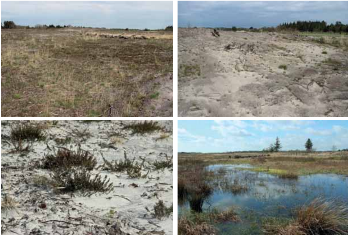
Abb. 5: Entwicklung der Sandheide auf dem Galgenberg; solche offensandigen Heiden sind Lebensraum für besonders stark gefährdete Arten, da sie in Schleswig-Holstein fast nicht mehr vorkommen; auch die kleinen Kesselmoore entwickeln sich nach der Freistellung wieder

Ein bisher ungelöstes Problem ist die inzwischen stark einsetzende Vermoosung der offenen Sandflächen, die ja gerade für viele Insektenarten besonders bedeutsam sind. Ursächlich sind hierfür vermutlich die hohen Nährstoffeinträge über die Luft und die Niederschläge, insbesondere aus den stark gedüngten landschaftsprägenden Maisäckern.