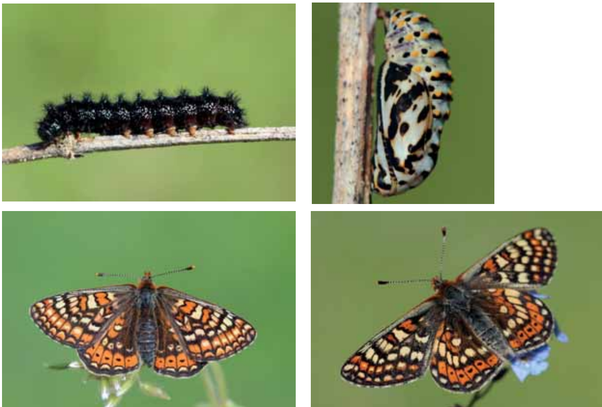
Abb. 27: gezüchtete Raupe und Puppe sowie Weibchen und Männchen des Goldenen Scheckenfalters

Die Zucht verlief sehr erfolgreich, weshalb sie für Wiederansiedlungsvorhaben aber auch zur Stützung kleiner Populationen von Schmetterlingen besonders geeignet ist. Dabei sollte auf eine möglichst große genetische Vielfalt geachtet werden, weshalb im Projekt 2015 nochmals 300 Raupen aus Dänemark geholt wurden.