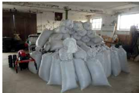
Abb. 13: Einsatz eines kleinen Mähreschers zur Gewinnung von Saatgut; eingelagerte Säcke mit geerntetem Saatgut

Im Projekt wurden beide Verfahren angewendet, wobei die gleiche Spenderfläche auf dem Truppenübungsplatz Putlos beerntet und ähnliche/nebeneinander liegende Empfängerflächen auf der Geltinger Birk genutzt werden konnten. So war es möglich, beide Verfahren hinsichtlich des übertragenen Artenspektrums sowie der Keimungsraten zu vergleichen. Dies erfolgte in Kooperation mit der Abteilung „Ökologie und Naturschutz“ des Institutes für Botanik an der Universität Regensburg.