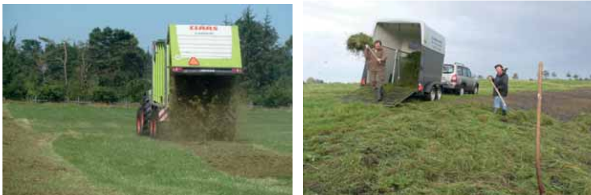
Abb. 12: großflächiger Auftrag von Mahdgut mit landwirtschaftlichem Gerät; händische Ausbringung bei kleinen oder schlecht zugänglichen Flächen

Die ausgebrachten Samen sollten möglichst von einer lockeren 2-4 cm des restlichen Mahdgutes überdeckt sein, um eine Austrocknung zu verhindern.