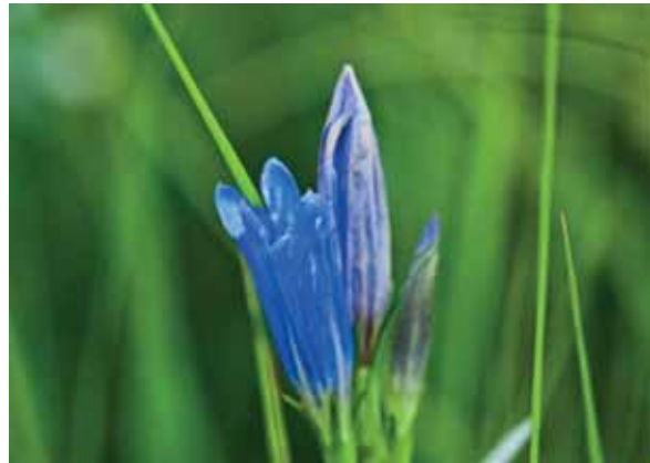
Abb. 7: Galloways in der Heidelandschaft von Nordsee; viele seltene Pflanzenarten, wie Lungen-Enzian (Bild), Englischer Ginster oder Wald-Läusekraut, breiten sich wieder aus

Das unterschiedliche Fraßverhalten von Rindern, Pferden und Ziegen, wie auch die individuell unterschiedliche Bevorzugungen bestimmter Pflanzenarten, führt zu verschiedenen intensiv genutzten Bereiche innerhalb der Weideeinheiten. Dadurch wird die Vegetationsstruktur kleinräumig verschieden ausgebildet und es entsteht eine mosaikartige Strukturvielfalt. Demgegenüber führt eine Mahd mit Großgeräten immer zu einheitlichen Strukturen, wozu auch die zum Einsatz der Mahdgeräte notwendige Einebnung der Bodenoberfläche zählt.