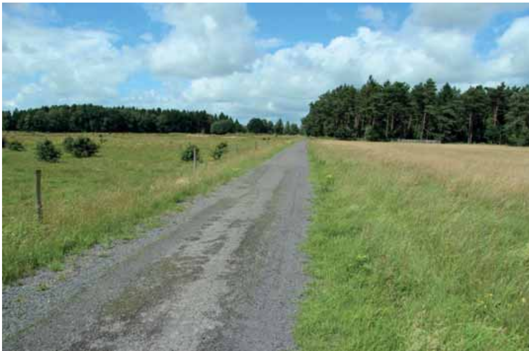
Abb. 8: vergleichender Blick auf ganzjährige Weidefläche (links) und Mahdfläche (rechts) im NSG Binnendüne Nordoe

Oft ist eine Mahd bei kleinen Flächen die einzige mögliche Pflegeoption, da sie für Tiere kaum ausreichend Futter bieten sowie bei sehr feuchten Gebieten, wo die Vegetation ansonsten durch Vertritt geschädigt werden kann. Andererseits kann bei reichlichen Niederschlägen eine Mahd feuchter Flächen auch gänzlich oder zumindest zum eigentlich gewünschten Zeitpunkt unmöglich sein. Hier bieten sich eventuell Spezialmäher oder kleine Mahdgeräte an.