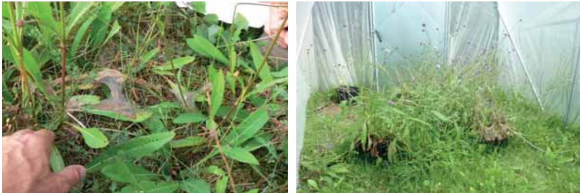
Abb. 25: Raupengespinste an eingetopftem Teufelsabbiss; Blick in das Zucht-Gewächshaus

Nahrungspflanzen, die Verpuppung sowie die Weiterzucht mit den geschlüpften Faltern wesentlich, da diese einfach im Gewächshaus verbleiben konnten.