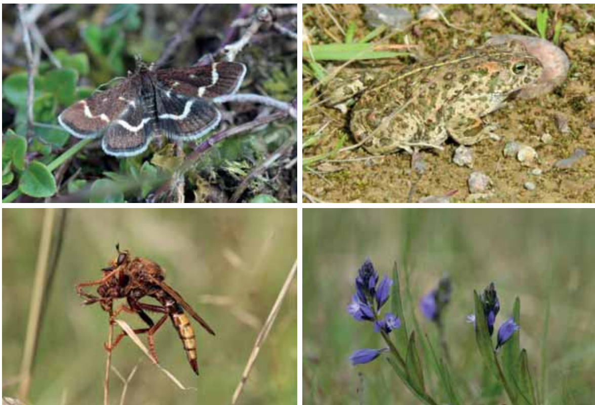
Abb. 33: der Zünslerfalter Pyrausta nigrata , die Kreuzkröte, die Hornissen-Raubfliege und das Gemeine Kreuzblümchen zählen zu den Profiteuren der Pflegemaßnahmen

Besonders hervorzuheben ist mit 26 festgestellten Arten eine sogar bundesweit bemerkenswerte Anzahl koprophager Käfer. Dazu zählt mit Aphodius punctatosulcatus sogar ein Neunachweis für Schleswig-Holstein (mündl. Mitt. R. Suikat).