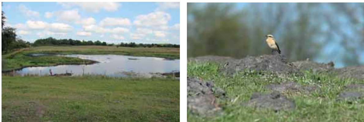
Abb. 3: Revitalisierte Dünensenke am Treßsee; der Steinschmätzer ist als Zugvogel nun regelmäßig anzutreffen

Dort, wo Maßnahmen durchgeführt wurden, waren diese sehr erfolgreich. Beispielsweise führte die Unterbrechung der Drainagen einhergehend mit der Sanierung von Flatterbinse dominierten Senken in den Binnendünen des Treßsees zur Ansiedlung verschiedenster gefährdete Tierarten. Beispielsweise wanderten Moorfrosch und Knoblauchkröte in die Gewässer ein, Rastvögel wie Bekassinen und Waldwasserläufer waren teilweise in großer Anzahl anzutreffen. An Brutvögeln stellten sich Zwergtaucher, Kiebitze und Brandgänse ein.