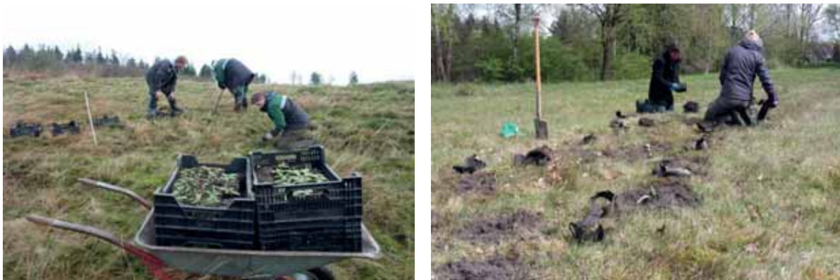
Abb. 16: Pflanzung von in 9er Töpfen angezogenen Setzlingen

Die Auswahl der Pflanzorte sollte aber bereits im Mai/Juni erfolgen.