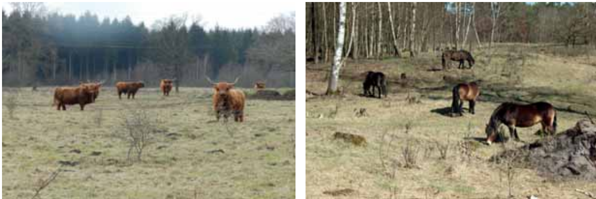
Abb. 18: Schottische Hochlandrinder und Exmoor-Ponys fressen erst über den Winter die von Obergräsern dominierten Streuauflagen

Die in den großen Projektgebieten auf Teilflächen beschränkten Habitate des Goldenen Scheckenfalters müssen deshalb in jedem Jahr nach dem Winter gut beweidet und vor allem die Gräser möglichst kurz gefressen sein. Demgegenüber sollten die Flächen dann zur Falterflugzeit nicht zu stark aufgesucht werden, um einen möglichst vielfältiges Blütenangebot verschiedener Arten zu gewährleisten. Diese Entwicklungen gilt es zu beobachten und, falls notwendig, durch gezieltes Koppeln oder Aussperren der Tiere zu steuern.