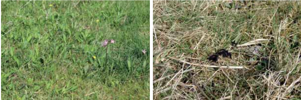
Abb. 1: optimal entwickelter Lebensraum des Goldenen Scheckenfalters auf Reesholm; die Raupen müssen sich nach Überwinterung in niedriger Vegetation sonnen können

Raupennahrungspflanze des Goldenen Scheckenfalters, dem Teufelsabbiss, sind die Vegetationsstruktur, die Exposition und die Bestandsdichte weitere entscheidende Faktoren für eine erfolgreiche Etablierung. Zudem benötigt der Falter über den Zeitraum seiner Flugzeit ein gutes Angebot verschiedener Blütenpflanzen.