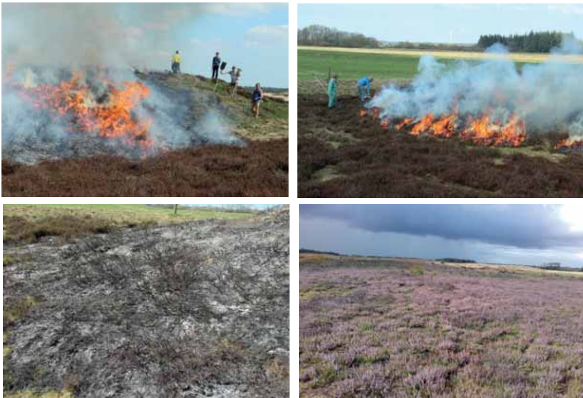
Abb. 6: Einsatz kontrollierten Feuers zur Heideregeneration; Brandfläche nach dem Feuer sowie mit großflächig blühender Besenheide im folgenden Jahr

Im Projekt wurde der durchgeführte Heidebrand, mit den entsprechenden Genehmigungen, von Feuerökologen aus Freiburg geleitet und koordiniert (Arbeitsgruppe Feuerökologie Freiburg)