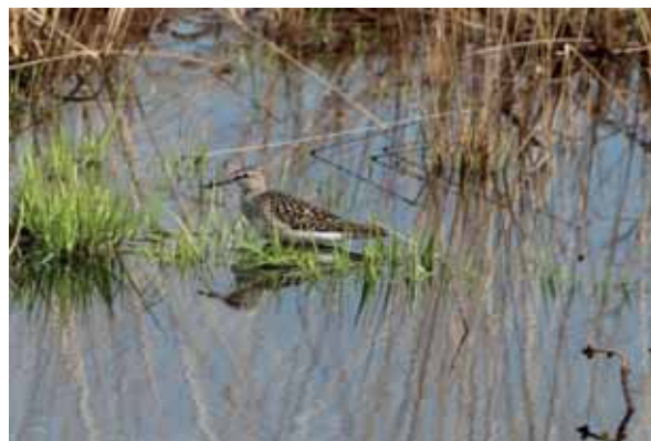
Abb. 34: Gefleckte Heidelibelle und Dunkler Wasserläufer