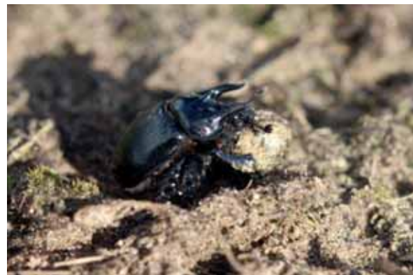
Abb. 22: Pferdedung ist bei vielen Mistkäfern beliebt, die Lage der Brutkammern wird durch den Bodenaushub kenntlich; der Stierkäfer ist eine große, vor allem im Frühjahr anzutreffende Art