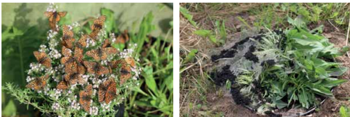
Abb. 26: gezüchtete Falter an Thymian; Raupen im letzten Larvalstadium in der Zuchtanlage

Die Falter vermehren sich leicht und ohne großen Aufwand. Es müssen nur ausreichend Nektarpflanzen sowie gut entwickelte und frei von den Weibchen anzufliegende Teufelsabbisse für die Eiablage zur Verfügung stehen. Auch die Nektarpflanzen wurden als Topfpflanzen aus einer giftfrei wirtschaftenden Gärtnerei geholt und in die Zuchtanlage gestellt. Besondere gerne wurden beispielsweise Thymian und verschiedene Nelkenarten von den Faltern aufgesucht.