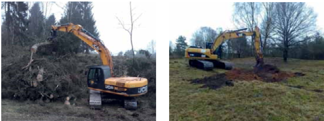
Abb. 17: Bagger mit Fällgreifer beim Abnehmen von Fichten; die Rodung mitsamt Wurzelstock ist beim Weißdorn die geeignetste Methode

Der Einsatz von Baggern mit Fällgreifer empfiehlt sich in der Entwicklungspflege bei großen Nadelbäumen, die dann auch nicht mehr austreiben. Große Pionierbaumarten wie Birken sollten zunächst abgesägt und nachfolgend die Stubben gerodet werden.