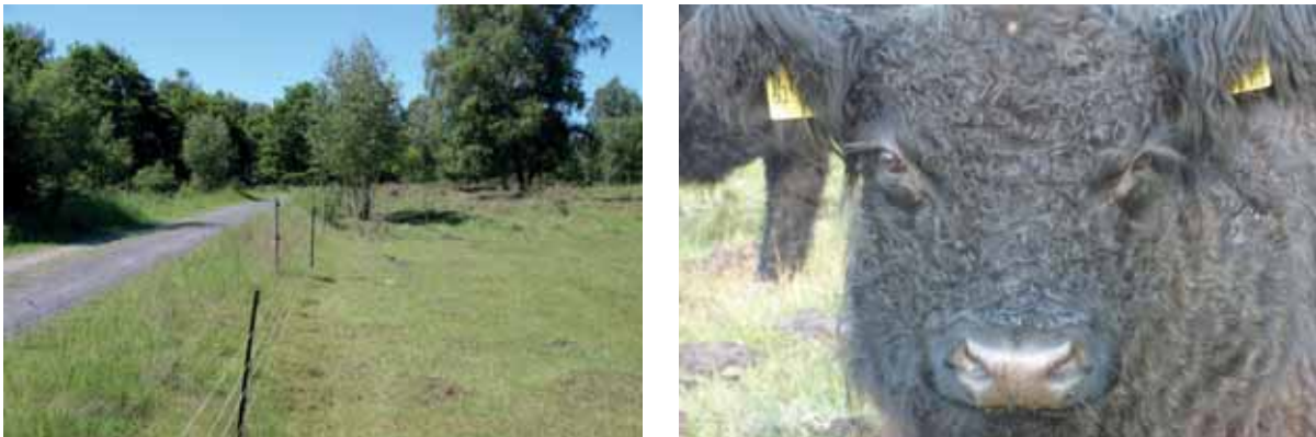
Abb. 19: Blick auf beweidetes Magergrünland und unbeweidete Randfläche im Mai; Galloway

Die Effekte einer Winterbeweidung sind naturschutzfachlich unter mehreren Aspekten bedeutsam. Aufgrund der momentan starken Nährstoffeinträge über die Luft und Niederschläge kommt es zu starken Konkurrenzverschiebungen innerhalb der Vegetation zugunsten starkwüchsiger Obergräser, aber auch von Brombeeren und Gehölzen. Damit verändern sich gleichzeitig die mikroklimatischen Bedingungen gerade für an Wärme und Trockenheit angepasste Arten sehr stark zu kühl-feuchten Standortbedingungen.