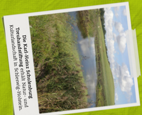
Die Karl-Heinz Schulenburg Treuhandstiftung erhält Natur- und Kulturlandschaft in Schleswig-Holstein.