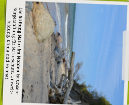
Die Stiftung Natur im Norden ist unsere Bürgerstiftung für Naturschutz, Umweltbildung, Klima und Heimat.