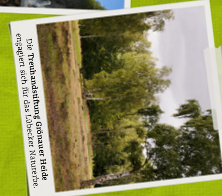
Die Treuhandstiftung Grönauer Heide engagiert sich für das Lübecker Naturerbe.