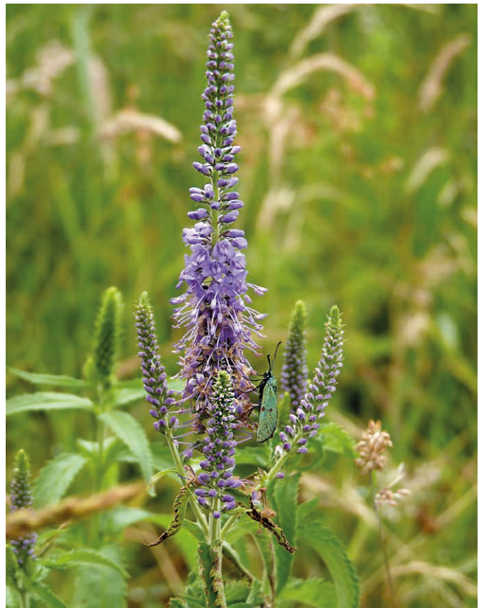
Abb. 3: Langblättriger Ehrenpreis ( Veronica maritima ) mit Blütenbesuch vom Ampfer-Grünwiderchen ( Adscita staites ) wurde als Regio-Plus-Art zusammen mit einer Regio-Saatgut-Ergänzungsmischung und Mahdgut auf einer mageren Flussauenwiese an der Pinnau ausgebracht. Die Art war früher in den Flussniederungen Norddeutschlands verbreitet, aber damit auch auf einen speziellen Lebensraum beschränkt, sodass sie nicht die Kriterien einer Regio-Saatgut-Art erfüllt. Als Regio-Plus-Art bekommt sie in Schleswig-Holstein eine zweite Chance in Naturschutzprojekten.

Über 739 Gefäßpflanzenarten wurden 2014 bei einer Wertgrünlandkartierung des Landes Schleswig-Holstein erfasst (Lütt et al. 2018), davon haben über 300 Kräuter und Grasartige in den Grün- und Offenlandlebensräumen Schleswig-Holsteins ihren Verbreitungsschwerpunkt (vgl. Tab. A im Online-Zusatzmaterial 2 unter https://online.natur-und-landschaft.de/zusatz/11_2022_A_Dolnik ). In den klassischen Regio-Saatgutmischungen sind je nach Standortverhältnissen jeweils 25 – 40 der häufigsten Arten enthalten. Für den Arten- und Biotopschutz sind jedoch für die Sicherung und Wiederherstellung artenreicher Lebensräume die nur mäßig verbreiteten und seltenen Pflanzenarten von großer Bedeutung, deren Bestände durch die Intensivierung bzw. Änderung der Landnutzung inzwischen gleichfalls gefährdet sind (Lütt et al. 2018; Jansen et al. 2019). Nahezu jede zweite Pflanzenart steht in Schleswig-Holstein auf der Roten Liste (Romahn