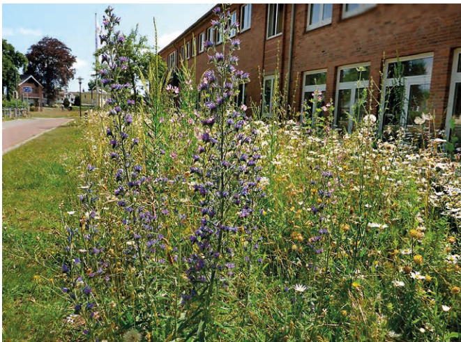
Abb. 4: Aus Regio- und Regio-Plus-Saatgut zusammengestellte Insektenaummischung u. a. mit Gewöhnlichem Natternkopf ( Echium vulgare ), Wiesen-Margerite ( Leucanthemum vulgare ), Gewöhnlichem Wundklee ( Anthyllis vulneraria ), Färber-Resede ( Reseda luteola ), Gewöhnlicher Wegwarte ( Cichorium intybus ) und Wiesen-Flockenblume ( Centaurea jacea ) vor der Grundschule Rensefeld in Bad Schwartau (Kreis Ostholstein, Ursprungsgebiet UG 3).