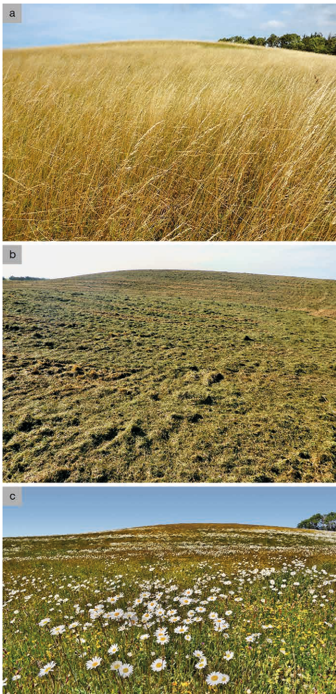
Abb. 1: Artenarmes Einsaatgrünland in Johannistal (Kreis Ostholstein): a) mit Wiesen-Glatthafer ( Arrhenatherum elatius ) vor Maßnahmenumsetzung, b) nach Umbruch des Einsaatgrünlands im Jahr 2016 durch Pflügen, wobei artenreiches Mahdgut vom benachbarten Truppenübungsplatz Putlos (6 km Entfernung) übertragen und um Druschgut von einer 23 km entfernten Margeritenwiese bei Lütjenburg ergänzt wurde, c) Blühaspekt mit Fettwiesen-Margerite ( Leucanthemum icrutianum ) und Gemeinem Hornklee ( Lotus corniculatus ) im dritten Jahr nach Beginn der Maßnahmenumsetzung.