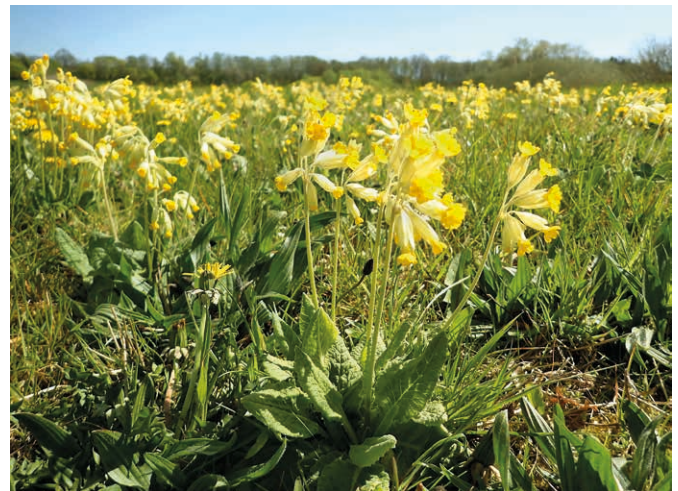
Abb. 6: Wiesen-Schlüsselblume ( Primula veris ) auf einer Wiese im Travetal bei Groß Wesenberg (Kreis Stormarn) im dritten Jahr nach der Auspflanzung bei nur sehr geringer Ausfallrate bei den Topfpflanzen.

Ziel des Projekts war der Aufbau einer Arche Gärtnerei als regionales Kompetenzzentrum für den Wildpflanzenanbau in Schleswig-Holstein, das nach Projektende als wirtschaftlicher Betrieb die Mutterpflanzenkulturen weiterführen und damit auch anderen