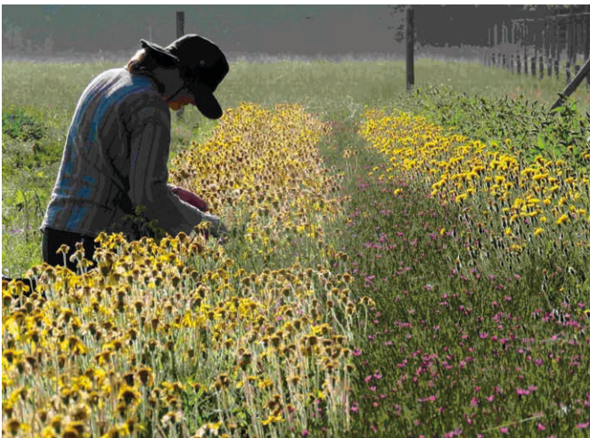
Abb. 2: Anbau von Regio-Plus-Arten wie Arnika ( Arnica montana , links), Heide-Nelke ( Dianthus deltoides , rechts) und Rauer Löwenzahn ( Leontodon hispidus , hinten rechts) in der Arche Gärtnerei in Eggebek. Arnika-Ernte in der Mutterpflanzenkultur ist Handarbeit. Arnika war früher auf der gesamten Geest und einigen Sanderflächen im östlichen Hügelland und damit knapp der Hälfte der Landesfläche Schleswig-Holsteins verbreitet, ist aber heute vom Aussterben bedroht.