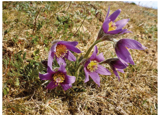
Abb. 5: Gut entwickelte Altpflanze der Gewöhnlichen Küchenschelle ( Pulsatilla vulgaris ) in der Ganzjahresweide Schäferhaus-Nord (Hügelgräber) bei Flensburg im Frühjahr 2020 sechs Jahre nach Auspflanzung. Trotz hoher Ausfälle von über 90 % sind solche erfolgreich etablierten langlebigen Stauden für das Überleben der Art entscheidend. Ohne die Wiederansiedlung wäre die Population in Schleswig-Holstein bereits erloschen. Aktuell können dagegen erste Naturverjüngungen am Standort beobachtet werden.

Für die Regio-Plus-Saat gelten dieselben strengen Kriterien für die Basissaatgutsammlung und Vermehrung wie für zertifiziertes Regio-Saatgut. Das Ausbringungsgebiet der Regio-Plus-Arten ist auf dasjenige Teilgebiet (Subregion) innerhalb eines UG beschränkt, das von ihrem jeweiligen natürlichen Verbreitungsgebiet abgedeckt wird; es kann daher auch als subregionales Saatgut betrachtet werden. Damit müssen für alle Maßnahmen, in denen Regio-Plus-Saatgut verwendet werden soll, fachkundig abgestimmte Ergänzungsmischungen zum Regio-Saatgut erstellt werden. Kriterium für den Einsatz der Arten sind die in Florenwerken belegten Verbreitungsareale der Einzelarten (Christiansen 1953; Raabe 1987; NetPhyD, BfN 2013), denn auch hier gilt es, Florenverfälschungen zu vermeiden und die eventuelle Ausbildung lokaler Populationen zu berücksichtigen.